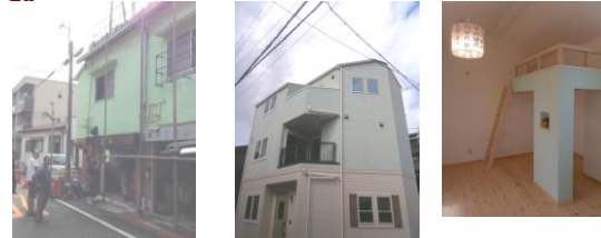
建替え前 → 新築完成