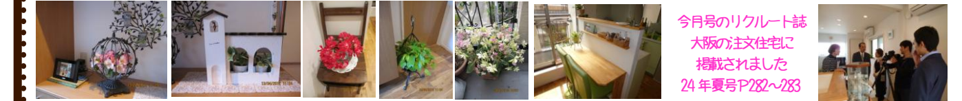
今月号のリクルート誌 大阪の注文住宅に掲載されました 24年夏号P282~283

おうちの上からしてもらって、それはそれは、みとれてしまうほどのきれいなお家です。江：「どうしたらこんなキレイさをキープできるんですか？」則子様：「タテとココを揃えておくといいらしい」と、簡単なコツを教えてくださいました。